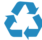
PEQUEÑAS INSTALACIONES INDUSTRIALES COMO RECICLADORAS